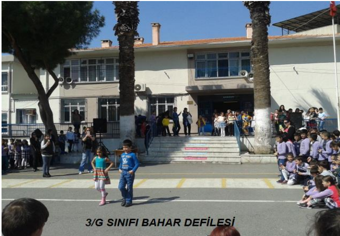
3/G SINIFI BAHAR DEFİLESİ

Baharın gelişinin kutlandığı coşkuyla karşılandığı bir gündür. Nev(yeni) ve ruz(gün) kelimelerinin birleşmesinden meydana gelen ve YENİGÜN anlamını taşıyan Nevruz, kuzey yarımkürede başta Türkler olmak üzere bir çok halk ve topluluk tarafından yılbaşı olarak kutlanır. Gece ile gündüzün eşitlendiği 21 Mart'ta güneş göçmen kuşlar gibi kuzey yarımküreye yönelir. 21 Mart ile birlikte havalar ısınmaya başlar, karlar erimeye, ağaçlar çiçeklenmeye, göçmen kuşlar yuvalarına dönmeye başlar. Bu nedenle 21 Mart bütün varlıklar için uyanış, diriliş ve yaradılış günü olarak kabul edilerek, Nevruz( Yenigün ) bayramı adıyla kutlanır.